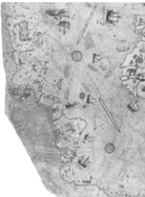
Ο χάρτης του Πίρι Ρείς

Το 1495 ο Κεντάλ Ρείς έλαβε επίσημο φερμάνι από τον σουλτάνο Βαγιαζίτ II (1481-1512), να συνδεθεί με την τουρκική πολεμική αρμάδα με το βαθμό του ναύαρχου. Πήρε μαζί του και τον ανιψιό του, ο οποίος επίσης εντάχθηκε με τον ίδιο βαθμό. Με αυτόν τον τρόπο οι δυο κουρσάροι έγιναν ναύαρχοι. Η συμμετοχή τους στις μάχες ενάντια στη βενετσιάνικη αρμάδα ήταν εντυπωσιακή (1500-1502). Τα μεγάλα πλεονεκτήματα που αποκόμισε η Οθωμανική Αυτοκρατορία από τη Συνθήκη της Βενετίας, οφείλονται κυρίως στη γενναιότητα των δύο ναυτικών. Μετά τον θάνατο του θείου του σε μια ναυμαχία το 1502, ο Πίρι Ρείς έστρεψε για πάντα την πλάτη του στις θάλασσες και ξεκίνησε μια νέα καριέρα ως χαρτογράφος. Λάτρης της τελειότητας, ο Πίρι Ρείς δεν μπορούσε να ανεχθεί λάθη στην σχεδιάσή του. Ο περίφημος χάρτης του σχεδιάστηκε το 1513[2] και χρησιμοποίησε ως πηγές διάφορους παλαιότερους χάρτες οι οποίοι, σύμφωνα με τον ίδιο, προέρχονται από τον Χριστόφορο Κολόμβο και άλλους, που χρονολογούνται πίσω στην εποχή του Μεγάλου Αλεξάνδρου. Οι χάρτες που τού αποδίδονται είναι διάσημοι για την ακρίβεια της προβολής τους.